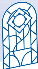
Tabla de diseño consiste en: